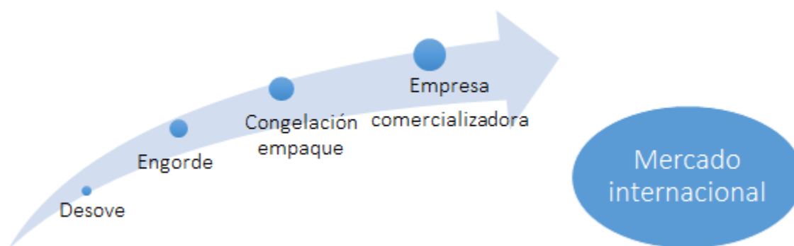
Figura 3. Procesos de la cadena de valor del camarón.

engorde y la cosecha del camarón y el proceso industrial de clasificación, envase y congelación. Cada uno de ellos tiene sus propias características, pero en conjunto forman una cadena de valor dentro de la misma estructura empresarial: la salida de cada proceso constituye la entrada del otro, y se le va agregando valor al producto entregado a la etapa siguiente. Visto como un conjunto de transformaciones que conducen al desarrollo productivo, el aprendizaje, la organización y la inserción en los mercados internacionales, la camaronicultura en el país funciona como una cadena doméstica de valor (CDV), cuya salida es la producción de camarón entero congelado (Figura 3).