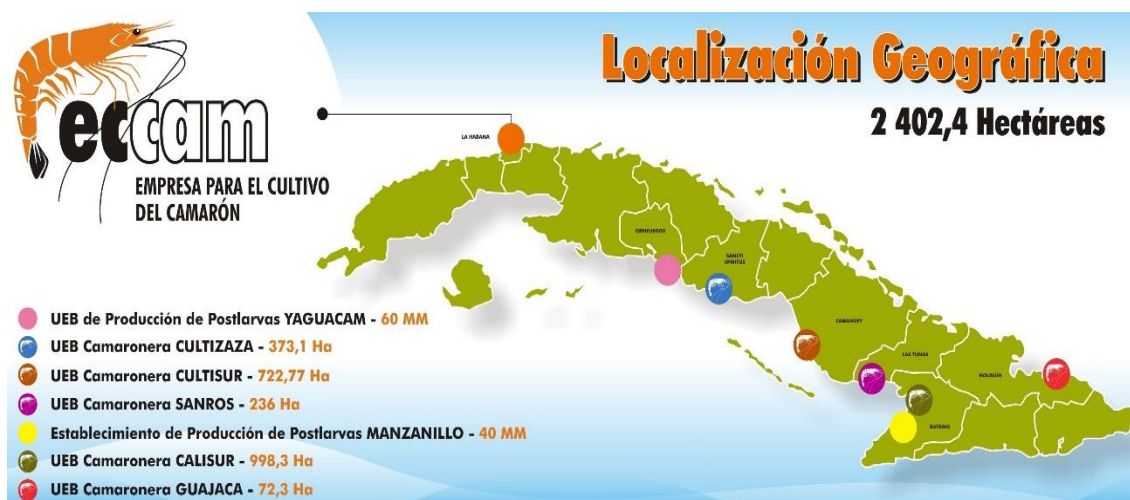
Figura 1. Localización geográfica de la ECCAM y sus UEB.

En el año 2011 el Ministerio de la Industria Alimenticia (MINAL) constituyó la Empresa para el Cultivo del Camarón (ECCAM), única de su tipo en el país, con el objetivo de planificar, organizar y controlar el cultivo del camarón. A ella se subordinan las granjas existentes, agrupadas en unidades empresariales de base (UEB) desde el centro hasta el oriente del país, donde las aguas son más cálidas y favorecen la cría de la especie (Figura 1).